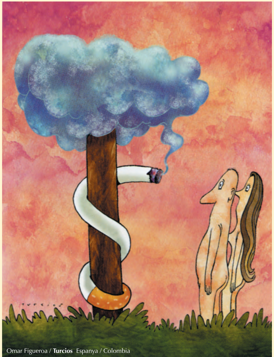
Omar Figueroa / Turcios España / Colombia